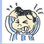
朝起きた時、頭痛がする