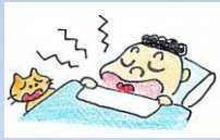
大きないびきをかく