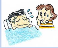
呼吸がとまっている