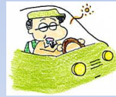
昼間、我慢できないほど眠くなる