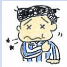
朝起きた時、スッキリしない